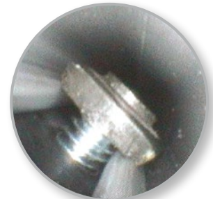
Sitz einer Schraube