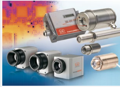
Sensoren und Messgeräte für berührungslose Temperaturmessung