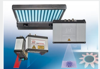
3D Messtechnik zur dimensionellen Prüfung und Oberflächeninspektion