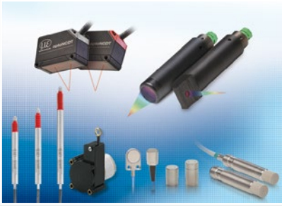
Sensoren und Systeme für Weg, Position und Dimension