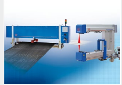
Mess- und Prüfanlagen zur Qualitätssicherung