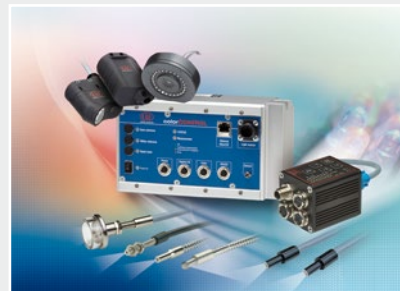
Sensoren zur Farberkennung, LED Analyser und Inline-Farbspektrometer