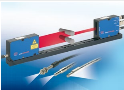
Optische Mikrometer, Lichtleiter, Mess- und Prüfverstärker